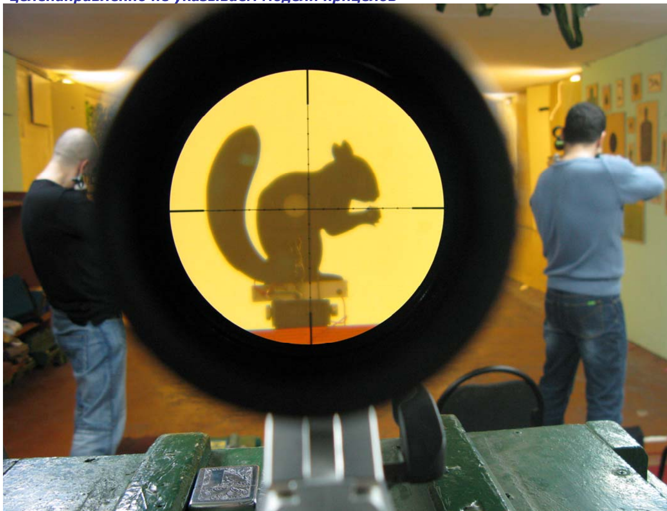
так выглядит мишень через некачественную оптику

Сравниваем качество оптики. Чтобы избежать рекламы, или антирекламы мы целенаправленно не указываем модели прицелов